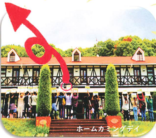
ホームカミングデー