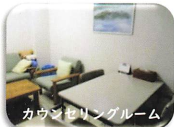
カウンセリングルーム