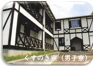
くすのき寮(男子寮)