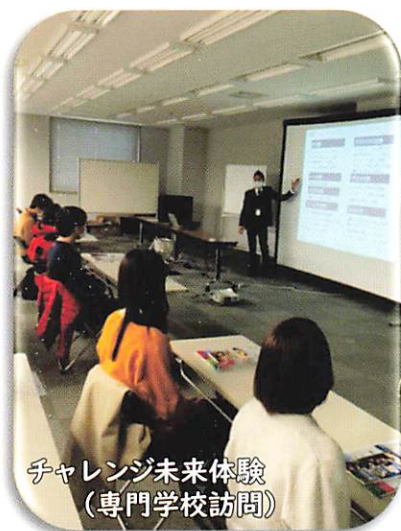
チャレンジ未来体験 (専門学校訪問)