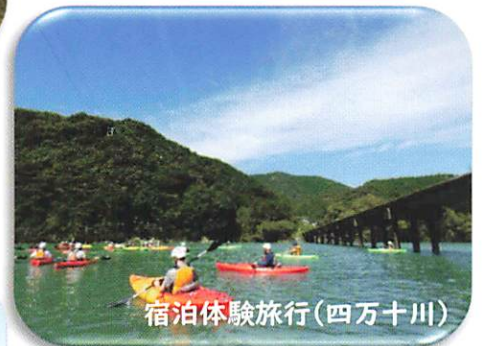
宿泊体験旅行(四万十川)