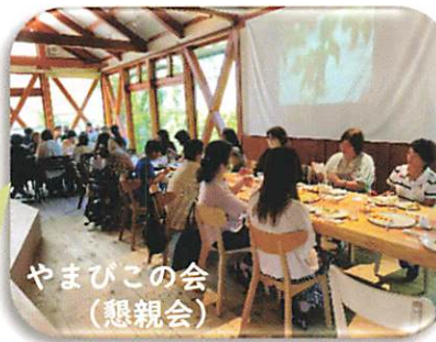
やまびこの会 (懇親会)

神出学園に入ると、本当に明るく前向きに顔までも変化していきました。23歳で入っても、友達もでき、様々な体験を通して成長しました。子育てはしんどいばかりだと幾度も涙した日々ですが、待っていればいつかは芽を出す、動き出す時が来るんだと確信しております。(48期修了生保護者)