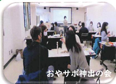
おやさポ神出の会